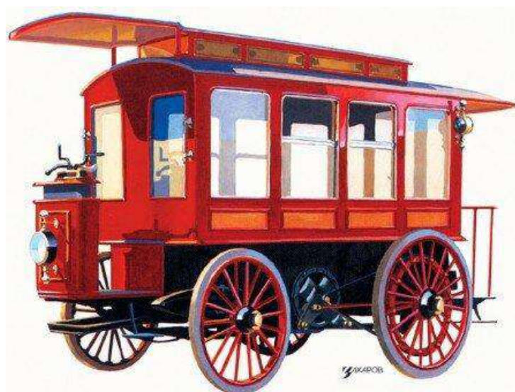
Рис. Электроомнибус И. В. Романова Рисунок с фабрики Фрезе и К о , 1899 г.

Однако, данные трудности не помешали совместной компании Романова и Фрезе разработать более вместительные электромобили (на перевозку уже 4-х человек), и в дальнейшем – электроомнибус (1899 год выпуска). Ниже представлена таблица с его техническими характеристиками.