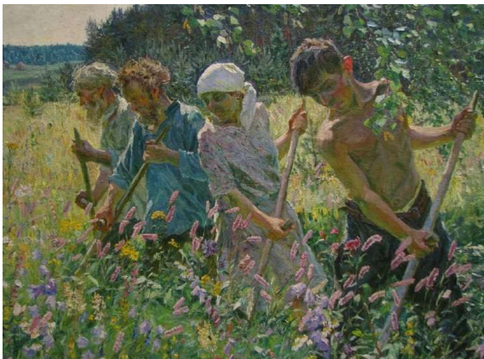
Картина Аркадия Александровича Пластова «Сенокос», 1945г.