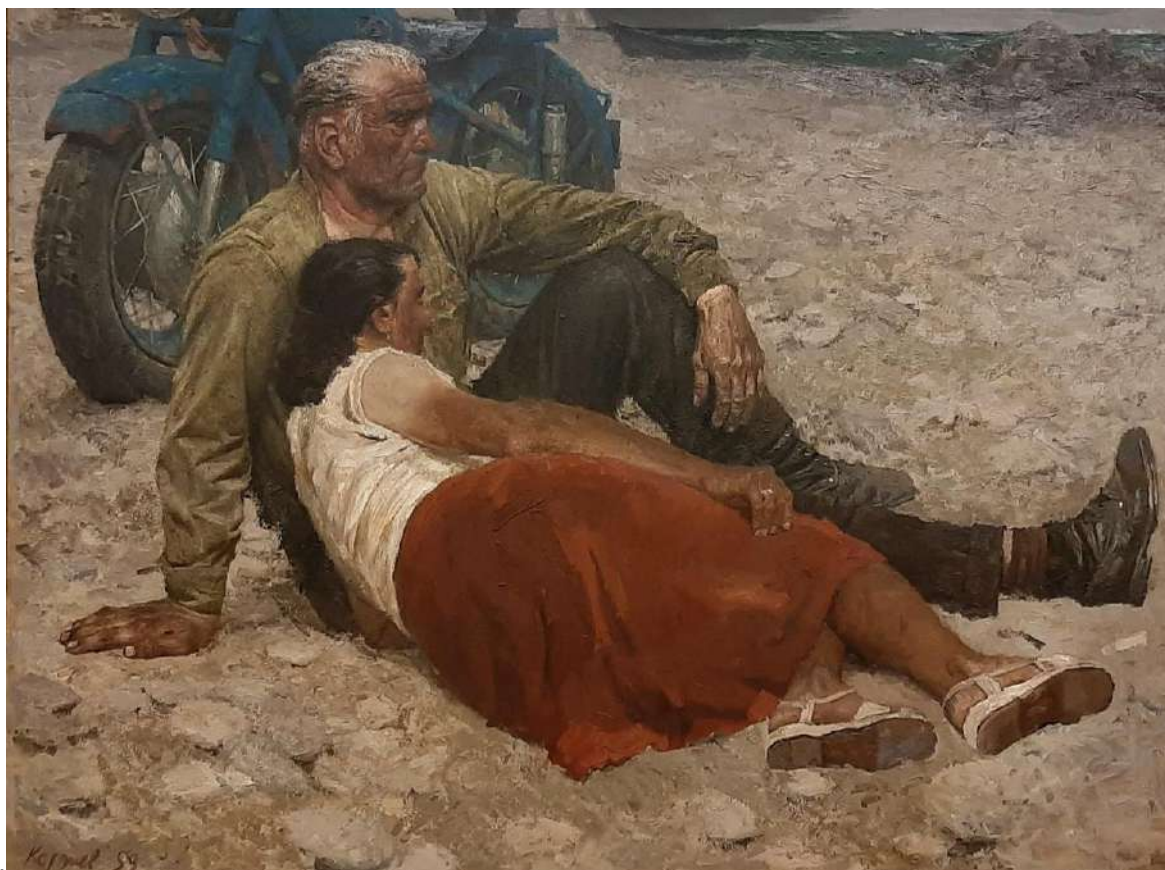
Картина Гелия Михайловича Коржева «Двое»/«Влюблённые», 1959г.

Всё послевоенное искусство находилось в некоторых отношениях друг с другом, отношениях проявлений скрытых смыслов. Внутренняя связь живописи, поэзии, литературы того времени очевидна, и также очевидна та преемственность, та великая традиция национального искусства при удивительном разнообразии и богатстве понимания, смыслов, которые обнаруживали люди искусства того времени. Это искусство вписано в первые послевоенные десятилетия и является, я в этом убеждён, порождением и следствием того нового ощущения мира, жизни, искусства, которое произошло после Великой Отечественной войны.