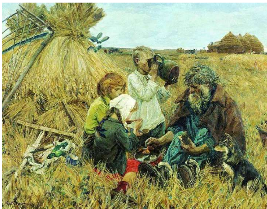
Картина Аркадия Александровича Пластова «Жатва», 1945г.