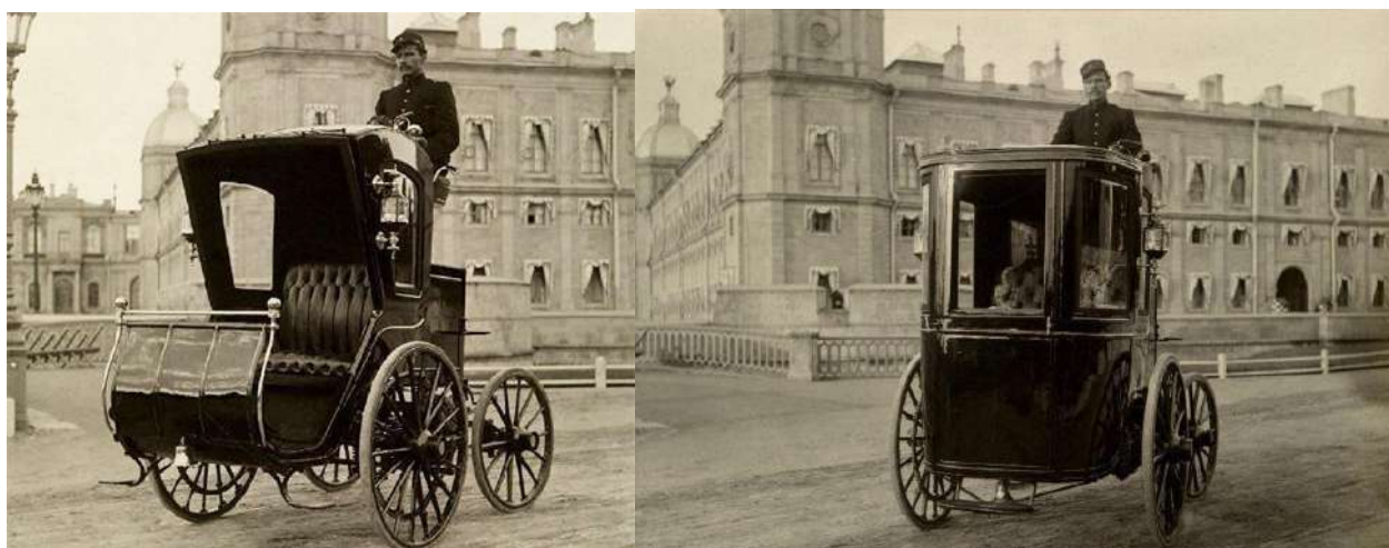
Рис. Электрические кэбы И. В. Романова: с открытым (слева) и закрытым (справа) салоном. Фотографии 1889 г.

Электрические кэбы были сходны по всем параметрам, только второй кэб имел ещё и салон закрытого типа с отоплением, что придавало ему дополнительную инновационность. Можно с гордостью отметить, что это были самые инновационные в то время электромобили в России.